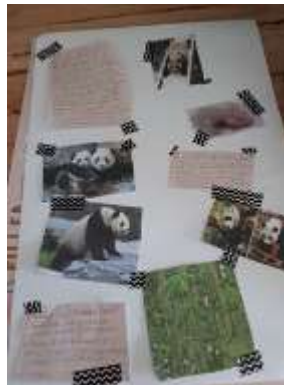
Collage uit groep 8B