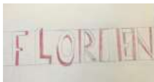
Tekenopdracht: schrijf je naam in 3D