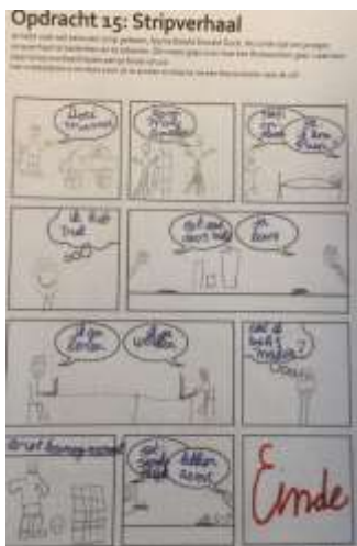
Opdracht stripverhaal ingeleverd in Teams