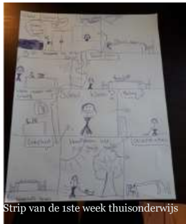
Strip van de 1ste week thuisonderwijs