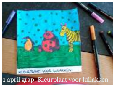
1 april grap: Kleurplaat voor luilakken