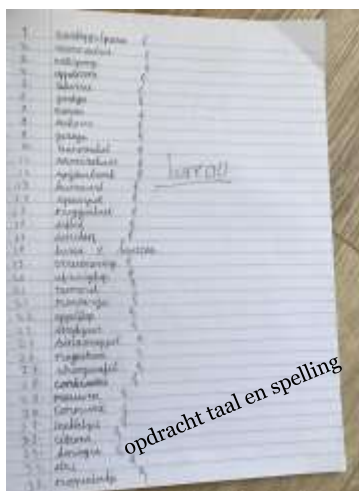
opdracht taal en spelling