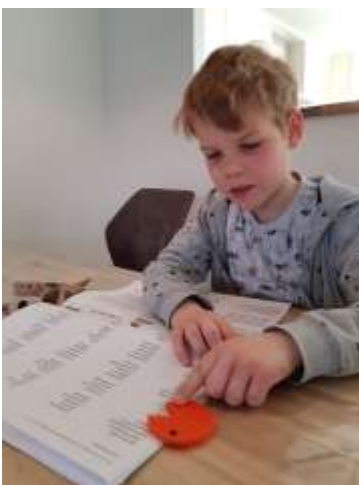
DMT lezen is er een stuk leuker op geworden.

Packman krijgt een dikke buik van alle woorden die hij op eet. Soms neemt hij even pauze. Laat een boer en eet het volgende (gecorrigeerde) woord weer lekker op.