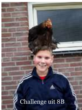
Challenge uit 8B